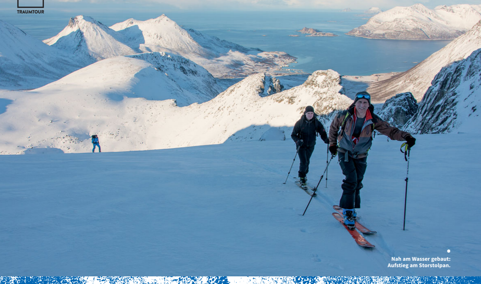
Nah am Wasser gebaut: Aufstieg am Storstolpan.

Wie im Himalaja. Nur, dass nirgendwo der Mount Everest hervorlugt. Haifischzähnen gleich hat der Wind messerscharfe Wechten an den Grat des Stetind gezimmert. Der Überstand aus Schnee an der Felskante sieht bissig aus. Dabei ragen die weißen Eisformationen mächtig über die Steilabbrüche an dem nord-norwegischen Gipfel. Der Sturm hört nicht auf, weiter Schnee an die Verwehungen zu kleben. Aber das ist ganz normal an einem Frühlingstag in den Lyngen-Alpen. Denn in den arktischen Gefilden nördlich vom Polarkreis herrscht im März noch Hochwinter.