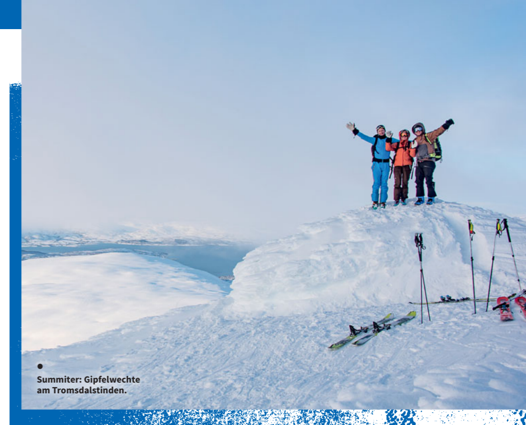
Summiter: Gipfelwechte am Tromsdalstinden.

Auch die Telemark-Variante war noch lange Zeit beliebt, bevor sich die modernen Skibindungen mit Fersenfixierung auch im Norden Skandinaviens durchsetzten. „Bis dahin aber bestanden die Abfahrten eher aus einer Aneinanderreihung von Spitzkehren und Schrägfahrten als aus Schwüngen“, gesteht Nordahl ein.