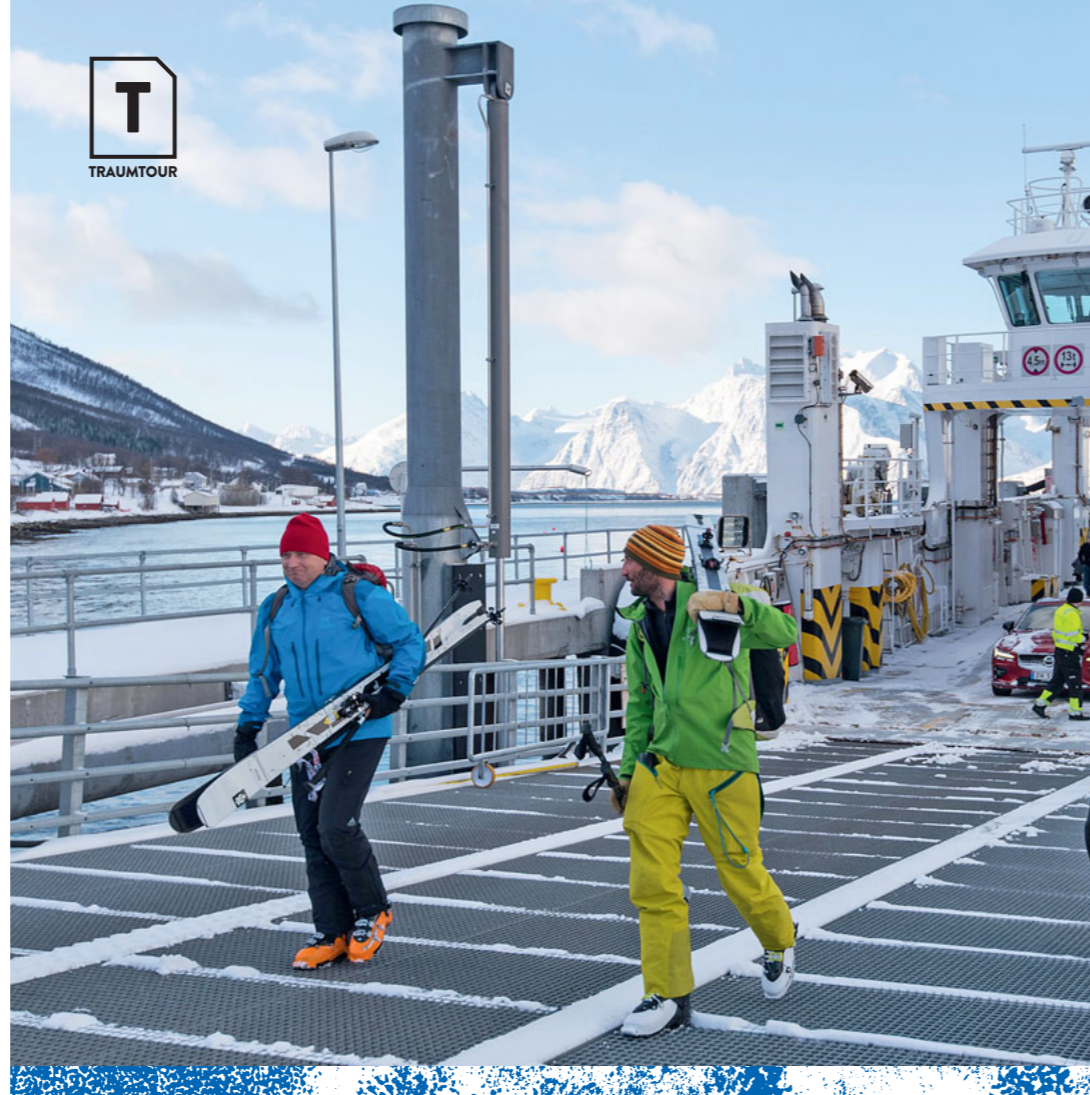
● Ship and ski: Ganz normal auf Uloya in den Kafjord-Alpen.

einer Skitour aufbrechen. Weil es für ein paar Stunden noch dunkel wird. Statt der Mitternachtssonne wird er aber die ausklingende Polarnacht erleben – mit allem, was dazu gehört. Und das sind die Polarlichter. Für die Jagd auf das arktische Himmelsfeuerwerk kommen alljährlich Tausende Menschen in die hohen nördlichen Breiten. Wer innerhalb einer Tourenwoche in der dunklen Jahreszeit nicht mindestens einmal die Aurora-Schleier am Himmel tanzen sieht, der muss schon ordentliches Pech haben. Für die Einheimischen ist das Naturschauspiel jedenfalls so alltäglich, dass sie nicht bei jedem Blinken am Firmament gleich aus dem Häuschen geraten. Die Besucher jedoch lassen sich nur allzu gerne von dem Farbenspiel in Grün, Rot oder Purpur verzaubern.