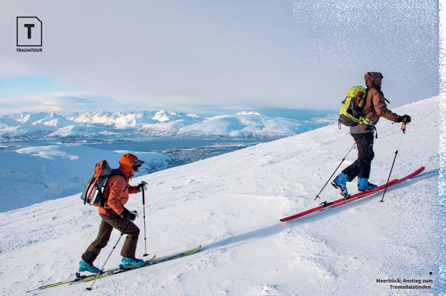
● Meerblick: Anstieg zum Tromsdalstinden.