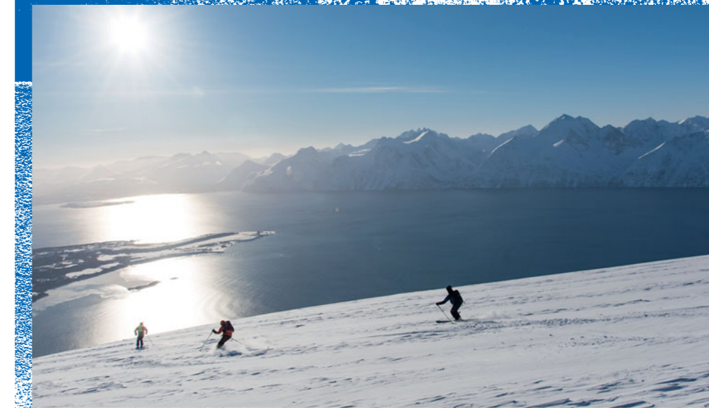
● Maritim: Downhill am Kjelvågstinden auf Uløya.

wenn tief unten aus den Schatten im Tal das schmale Band des Storvatnet-Sees heraufblinkt. Den Augen-Cocktail aus Schnee und Wasser kann man dann während der Abfahrt noch als Sundowner genießen. Denn auch das gehört zu Skitouren in der Arktis: Frühes Aufstehen ist nicht zwingend nötig. Je weiter die Saison vorangeschritten ist, desto länger wird die abendliche Dämmerphase, bis dann im Mai das Licht nördlich des Polarkreises nachts kaum noch ausgeht.