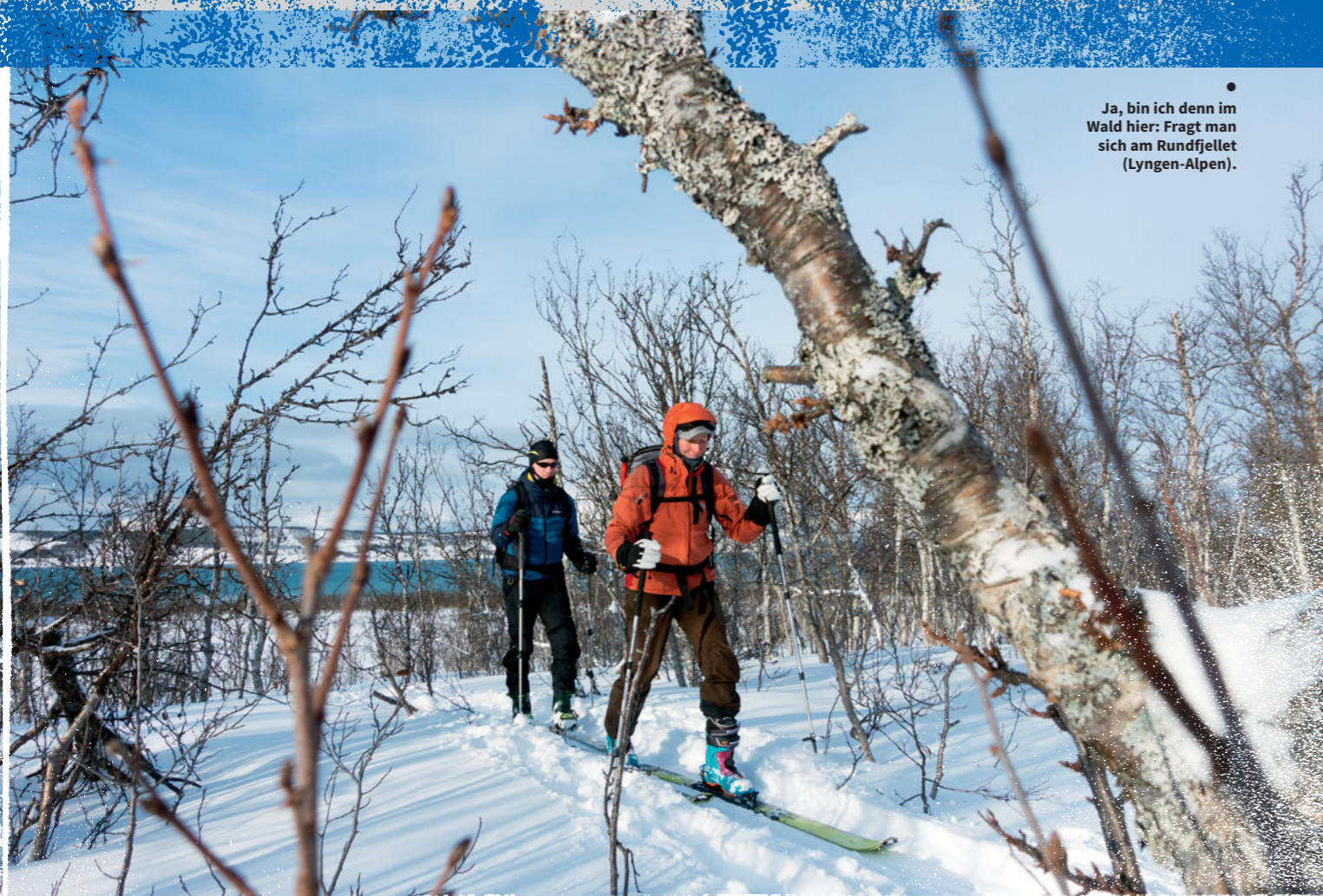
● Ja, bin ich denn im Wald hier: Fragt man sich am Rundfjellet (Lyngen-Alpen).

Apropos Abendlicht: Wer sich im Spätwinter in den Norden aufmacht, der kann vielleicht nicht – wie im Mai – noch abends um sieben zu >