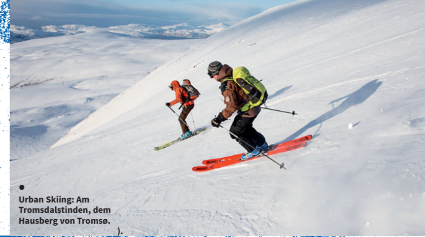
● Urban Skiing: Am Tromsdalstinden, dem Hausberg von Tromsø.

Wie in der Antarktis sieht es am Storstolpan aus: Scheinbar unendliche Schneeflächen prägen die Insel Kvaløya. Nur, dass am Storstolpa auf Kvaløya keine Pinguine herumlaufen, sondern Rentiere. Die Herde der skandinavischen Geweihter lässt sich auch gar nicht stören, als ein Trupp von Skitouristen an ihnen vorbeischnürt. Im Herzen der Insel nahe Tromsø liegt der knapp 1.000 Meter hohe Gipfel, der eine gute Auftakttour bietet, um zu checken, wie Skitouren im Norden schmecken. Leckeres Terrain gibt's allemal. Wenn auch nicht so steil und abweisend wie bei anderen Routen auf Kvaløya, das bekannt dafür ist, dass die Abfahrten hier ein bisschen mehr Gefälle aufweisen und man sich ein paar Gedanken mehr machen sollte, wo man seine Downhill-Line ziehen will. Geht es dann zur Spitze vom Storstolpa (974 m) hinauf, dann wird die Szenerie immer dramatischer: Raureifverzierte Felsen schmücken das Ende vom steilen Gipfelhang. Für die letzten Meter bieten sich Steigeisen an, um über die vereisten Klippen zu klettern. Ganz oben dann entschlüpft einem unwillkürlich und abermals ein leises „Wow!“, wenn sich in der Ferne die dunkelblauen Fluten des Nordatlantiks vor einem ausbreiten und