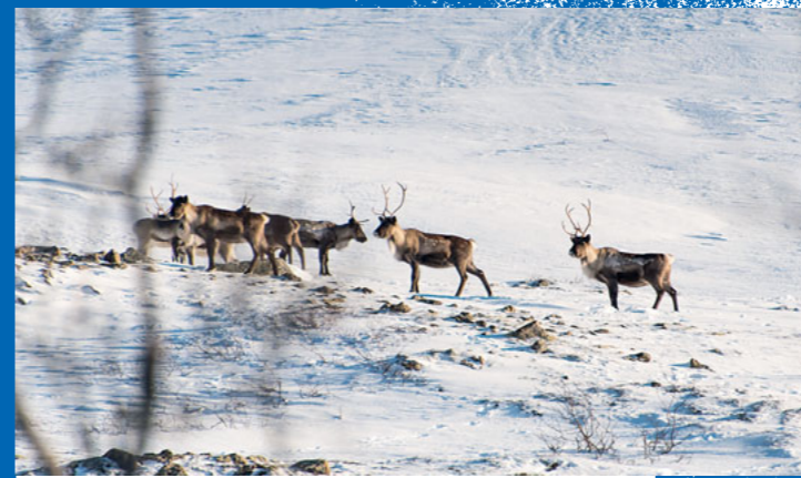
● Geweiht: Rentiere im Fjell.

Wasser tief drunten – egal, wohin man blickt. Ein echter Wow-Effekt! Den gibt's auch, als der Gipfel erreicht ist. Denn auf der einen Seite bauen sich die sanfteren und tief verschneiten Kåfjord-Alpen als Panorama auf. Von der anderen Seite des Meeresarms drohen schwarz die schroffen Klippen der nördlichen Lyngen-Berge herüber. Da könnte man doch auch mal eine Tour wagen, oder ...? Beim nächsten Mal! Heute bleibt noch der maritime Downhill hinunter nach Hamnes. Immer mit Blick auf die gleißende See. From summit to sea, yippie!