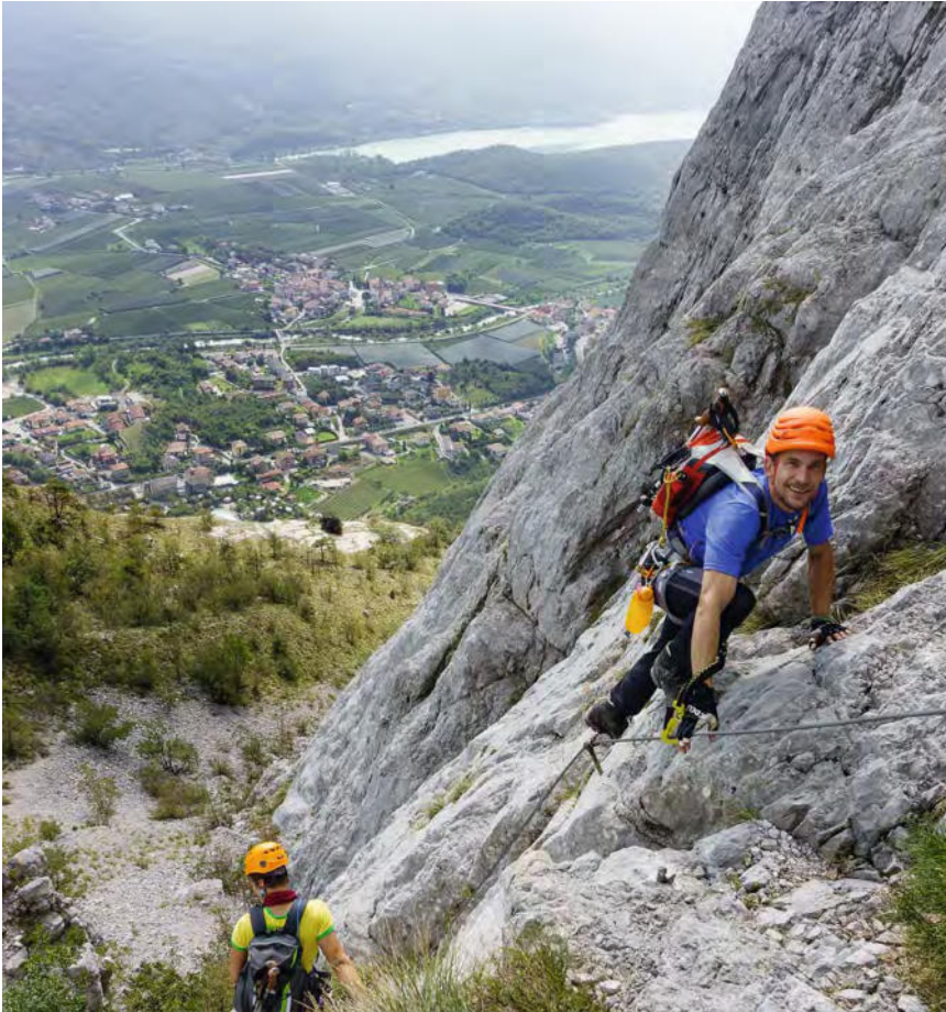
Ausdauernd: Die Drahtseil-Hängelei am Revoluzzer-Weg

Bruckmann ist einer der führenden Verlage für Reise & Outdoor. Unsere Leser begeistern wir u.a. mit folgender Marke: