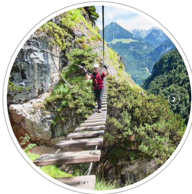
1 Durchgeblickt: Drahtseil-Kletterei an der Tofana di Mezzo hoch über Cortina d'Ampezzo 2 Kippelig: Auf der Seilbrücke am Grünstein ist Schwindelfreiheit von Vorteil.

5 Die eigenen Grenzen kennen. Touren sollten so gewählt sein, dass man bei Problemen nicht gleich am Limit ist. Das erhöht nicht nur die Sicherheit, sondern auch den Genuss.