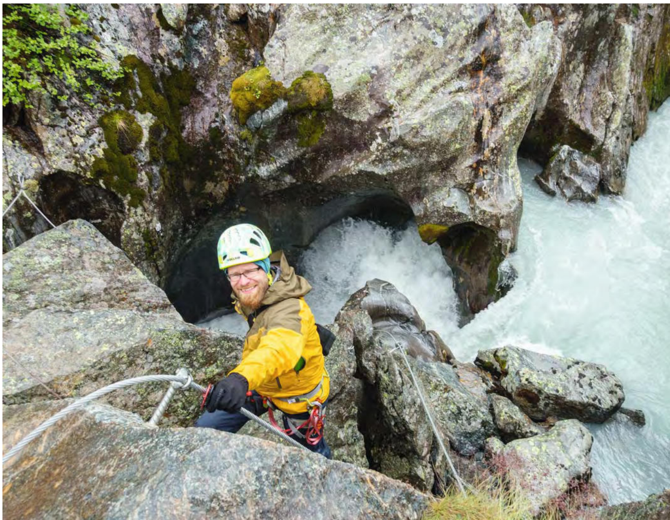
Tosend: Das Wasser im Höllenrachen macht einen Höllenlärm.