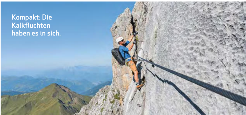
Kompakt: Die Kalkfluchten haben es in sich.

Start/Ende: Partnunstafel (1772 m) über St. Antönien (1418)