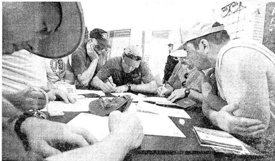
Escriba. Los amantes de la montaña que llegan de todas partes del mundo dicen que hay mucha burocracia.

Tampoco el instructivo detalla la tarifa actualizada de los aranceles, que en temporada alta para extran-